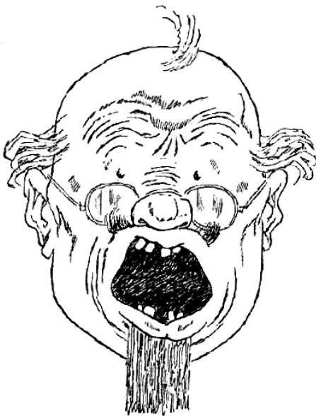
Альфонс! Альфонс! Альфонс!

Вставать и разыскивать Альфонса не хотелось, четырехдневная дорога растрясла организм порядком. Но вместе с тем вставать было нужно, так как до отъезда нужно было повидаться с московскими коллегами, кое-чем запастись, достать новые, советские карты Монголии... Монголия! Наконец-то, профессор находился на пороге необозримых, неисследованных стран, гигантских пустынь, свидетельниц всех возрастов истории, где каждый шаг мог сулить новые, неожиданные, потрясающие открытия... Мамонт, покрытый кожей с волосами и доставленный в один из русских музеев... Мертвый город Хара-Хото... Кости исполинских ископаемых... Все это факты,