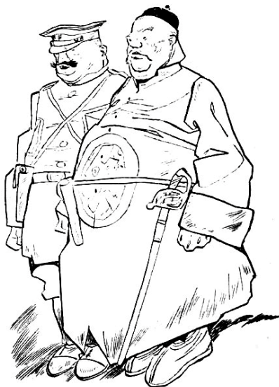
Представитель китайского генерала был надут и втиснен

Очнулся Васька — зверски избитый и связанный — на платформе бронепоезда; кругом сидели несколько русских солдат с винтовками. Ваську куда-то везли.