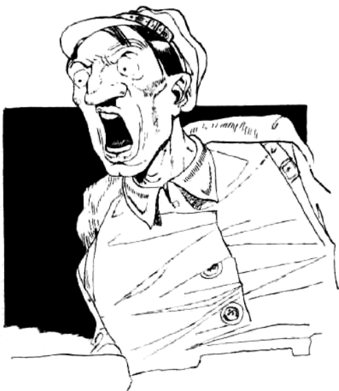
— Сюда, Сюда! — внезапно заорал Френкель, высунувшись из-за зубца... стены

По направлению к стене, опираясь на ружье, шел китаец. Френкель и проводник соскользнули со стены и двинулись к нему навстречу. Через десять минут выяснилось, что