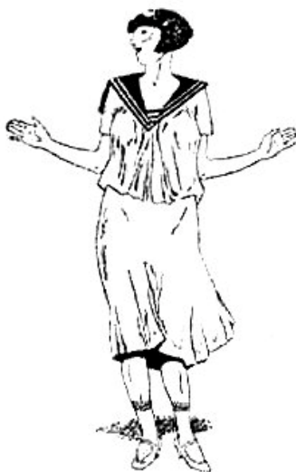
Отчаянно тряся плечами, изображая цыганскую пляску

«Вот она, стабилизация» — мелькнуло в голове у Свистунова. Он решительно подошел к