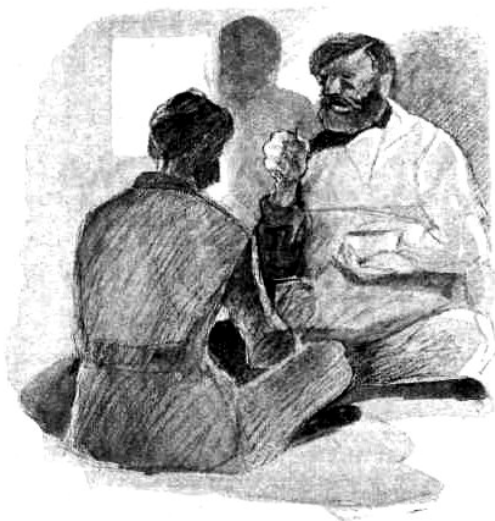
Похлебку дали, — с радостью сказал Антипыч. — Вот-ма, а чем же кушать-то?

Через час явился все тот же офицер и объявил, что цзянь четвертой народной армии Хаоли-Фу, посылая привет предкам Френкеля, не может дать никакой помощи; почтительно извиняется, потому что все бины (солдаты) на счету, а город под опасностью удара со стороны хитрой лисы — дудзюня провинции Фынь-Чжоу.