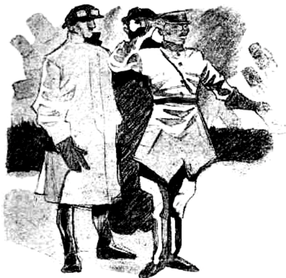
С машины сошли трое, один из них в форме офицера вытянулся и протянул пакет